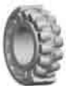
EM/YM 和 EMB/YMB